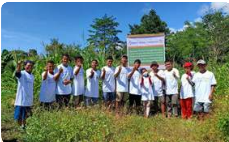
Proyek Pengembangan Usaha Holtikultura Horticulture Business Development Project

Sebagai bentuk kontribusi Bank terhadap pertumbuhan perekonomian daerah, Bank Ganesha telah memprioritaskan tenaga kerja lokal (yang memiliki domisili KTP sesuai wilayah operasional tempat bekerja) untuk bergabung menjadi insan Bank. Komitmen tersebut diwujudkan dengan karyawan yang seluruhnya merupakan Warga Negara Indonesia (WNI) dan 100,00% tenaga kerja lokal.