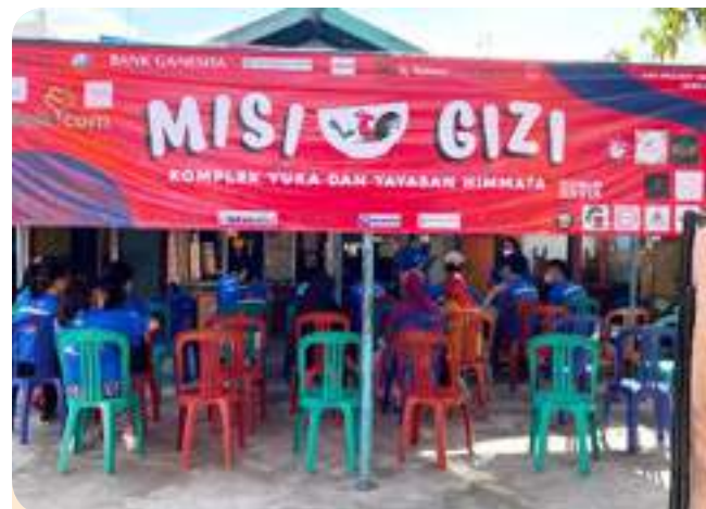
Acara Misi Gizi Misi Gizi Event

As a form of the Bank's contribution to regional economic growth, Bank Ganesha has prioritized local workers (those with domiciles in their National ID Card according to the operational area where they work) to join as Bank employees. This commitment is realized by employees who are all Indonesian Citizens (WNI) and 100.00% local workers.